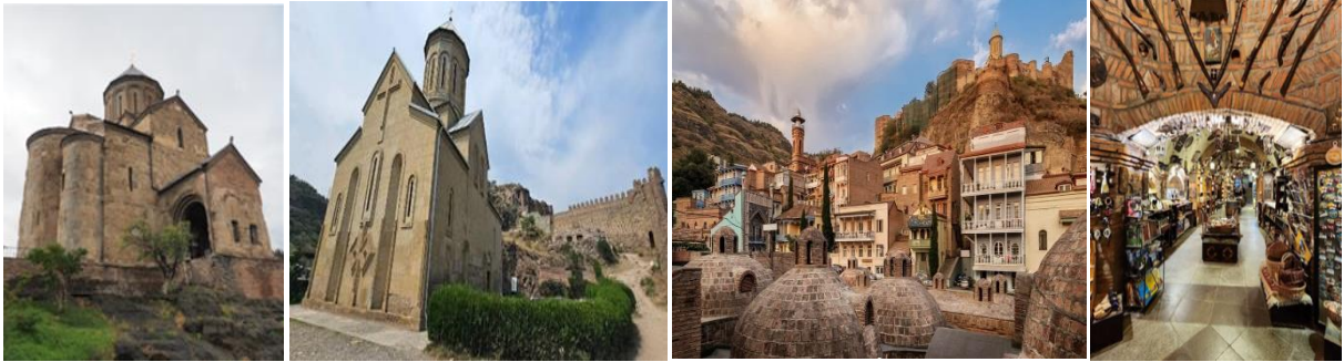
นำท่านเข้าสู่ที่พัก Iveria Inn Hotel หรือเทียบเท่า ★★★★★

วันที่ห้า เมืองทบิลีซี – วิหารจวารี – ป้อมอนานูรี – เมือง Pasaunauri – เมือง Stepansminda – โบสถ์เกอร์เกดี Russian-Georgian Friendship Monument – เมืองคูตาอูรี