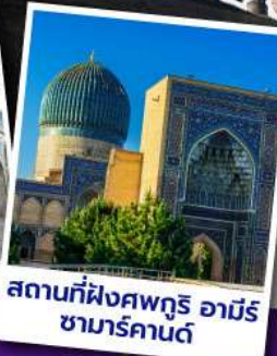
สถานที่ฝังศพกูรี อามิร ซามาร์คานด์