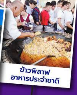
ข้าวพิลอฟ อาหารประจำชาติ